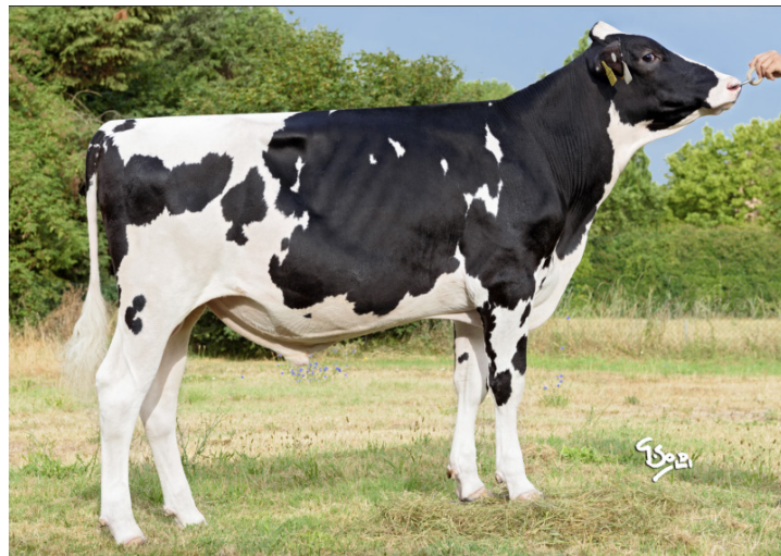
JUST IN TIME