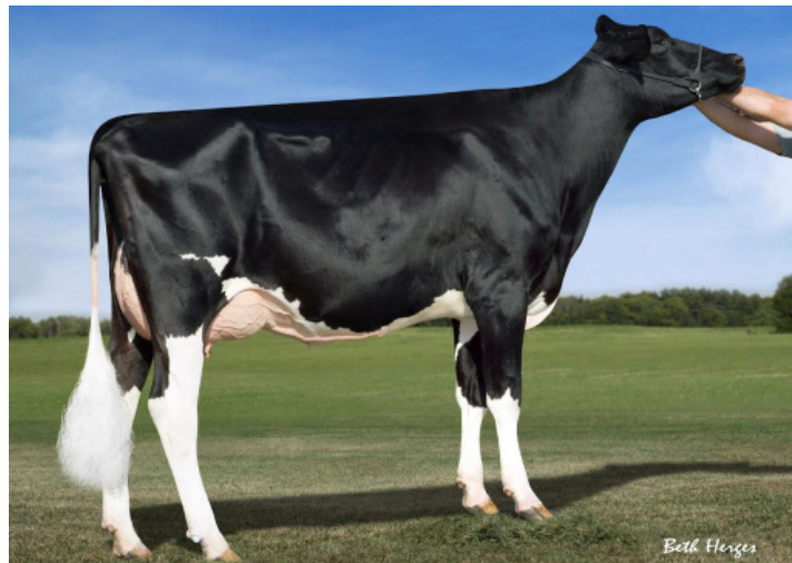
Le-O-La Superson Golden EX-90