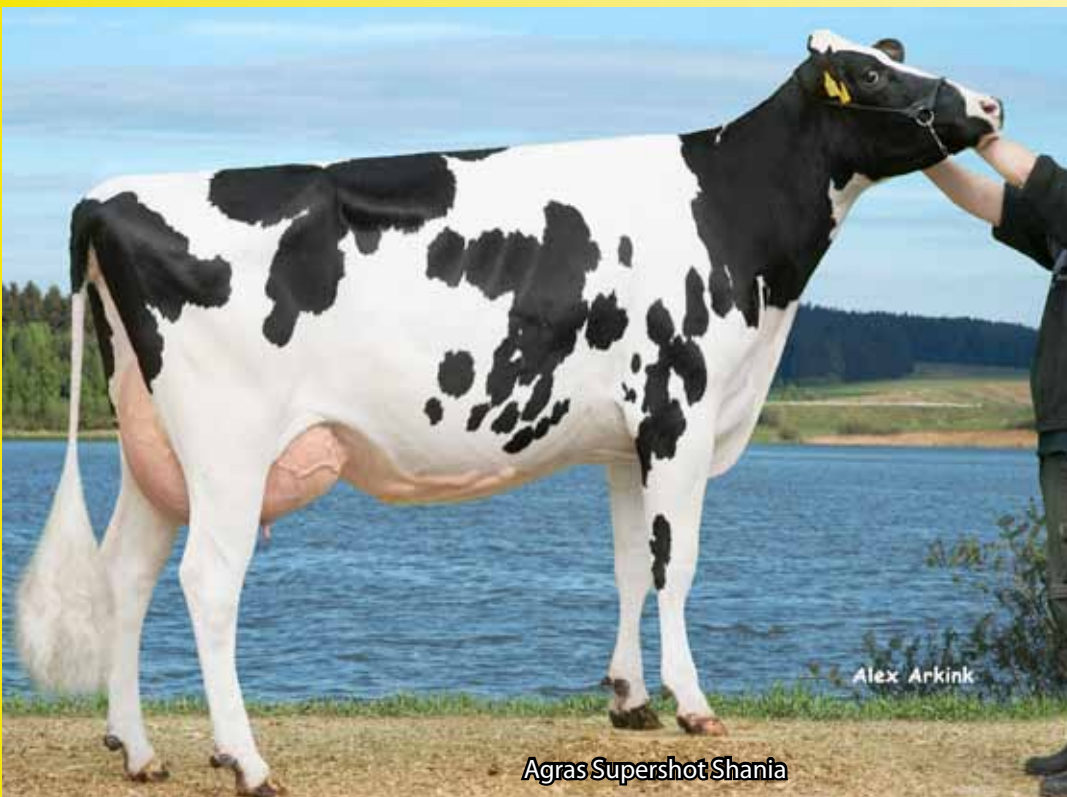
Agras Supershot Shania