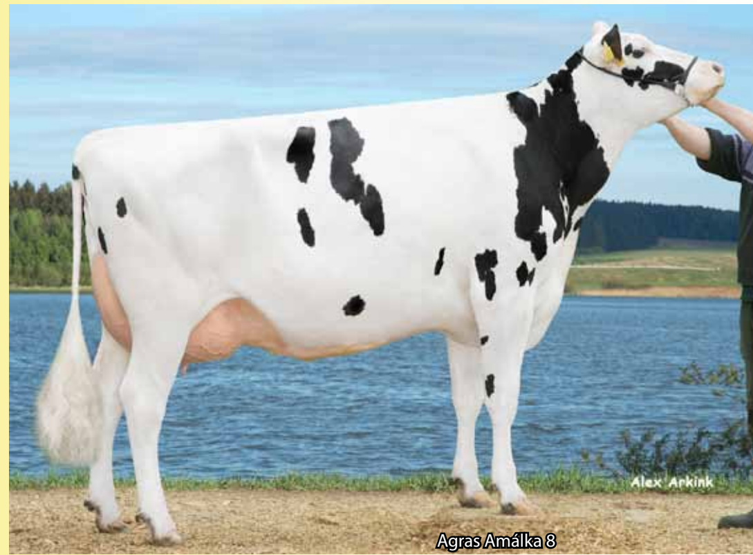
Agras Amálka 8