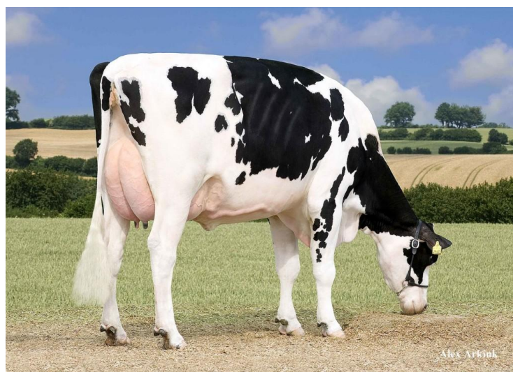
RR Nova Man O Man Extra Special VG-87