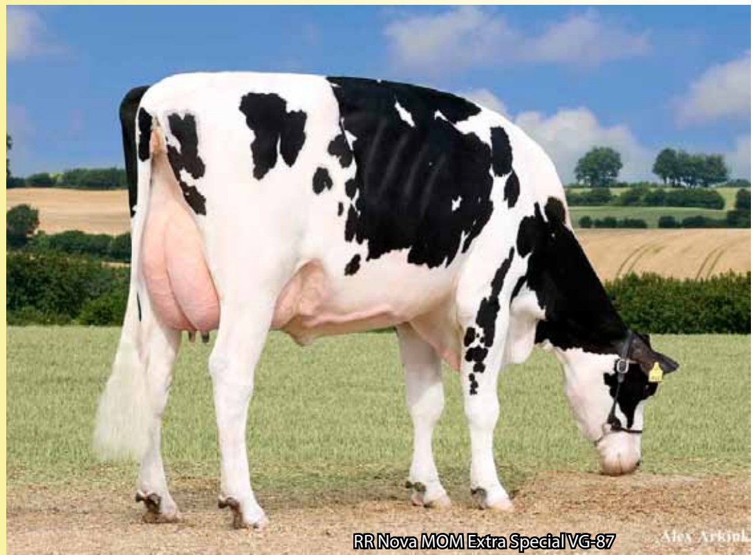
RR Nova MOM Extra Special VG-87